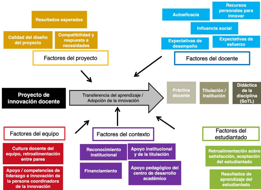
Figura 1. Relación de factores condicionantes del impacto de la innovación